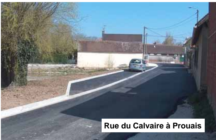
Rue du Calvaire à Prouais

Le non-respect de cet article 84 du Règlement Départemental Sanitaire entraînera les contrevenants à des poursuites en cas de plaintes auprès de la gendarmerie.